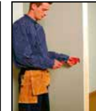
Poista sisäke ja työvaihe on valmis.