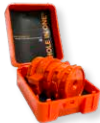
Tuoteno 800FXL+ Suomi HOLE IN ONE® -sarja, sisältää osat: