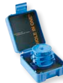
Art. nr. 800NXL+ Norja HOLE IN ONE® -sarja, sisältää osat: