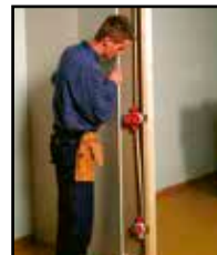
Aseta kipsilevy tai paneeli paikalleen.