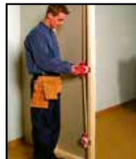
Aseta HOLE IN ONE -sisäke sähkörasiaan.