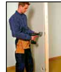
Tee reikä reikäporalla pitäen poraa etäällä rasiasta.