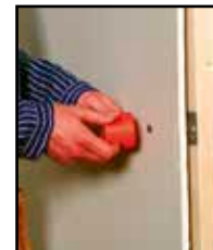
Etsi sisäke HOLE IN ONE 8:21F -ilmaisimella tai 2000F Super -ilmaisimella ja merkitse keskustan paikka.