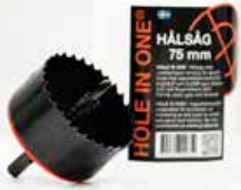
Tuotenro 2075 HOLE IN ONE® Reikäsaaha 75 mm ulostyöntöjousella

Soveltuu yksinkertaiselle kojerasialle sekä kojerasialle 1 1/2 yhdessä seuraavien kojerasiasisäkkeiden kanssa: 8:22, 8:22/8:27, 8:22SP, sisäke kaksoirasialle sekä kojerasiasisäke 1 1/2 rasiialle. Yhdessä ilmaisimen 8:21 sekä Superilmaisimen 2000 kanssa.