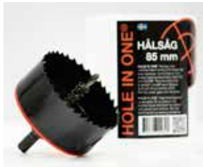
Tuotenro 2085 HOLE IN ONE® Reikäsaaha 85 mm ulostyöntöjousella

Hole-In-One SuperPro -magneettihakujärjestelmä helpottaa kaikenlaisien levyjen ja paneelien asennusta sähkörasioiden päälle. Katso koko valikoima osoitteessa www.jij-plast.se